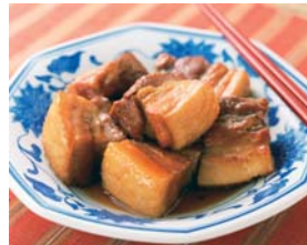
豚の角煮がやわらかく仕上がります。