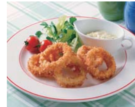
イカは噛みきれるかたさになります。